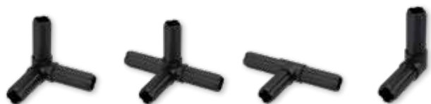
Giuntura ad angolo 3 perni nero